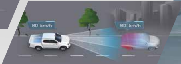
• ระบบควบคุมความเร็วอัตโนมัติแบบแปรผัน ACC (Full Speed Range Adaptive Cruise Control) พร้อมฟังก์ชัน Stop and Go