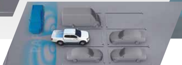
• ระบบช่วยเตือนขณะถอยรถ RCTA (Rear Cross Traffic Alert) พร้อมระบบเบรกฉุกเฉินอัตโนมัติขณะถอย RCTB (Rear Cross Traffic Brake)

BSM ระบบแจ้งเตือนจุดอับสายตา BSM (Blind Spot Monitoring)