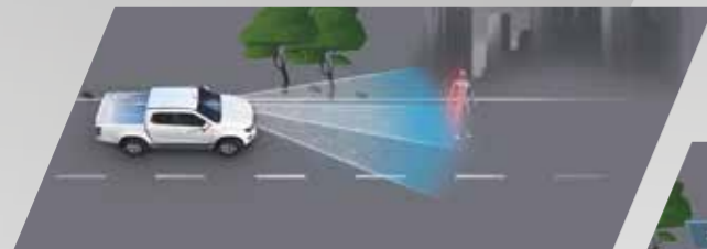
• ระบบแจ้งเตือนก่อนการชนด้านหน้า FCW (Forward Collision Warning) พร้อมระบบเบรกฉุกเฉินอัตโนมัติ AEB (Autonomous Emergency Braking)

มั่นใจสุด กับ ISUZU MATRIX SAFETY INTELLIGENCE ระบบช่วยเหลือผู้ขับขี่ ADAS ด้วย 3D Imaging Stereo Camera ที่มีมุมมองกว้างและแม่นยำกว่าเดิม พร้อมเรดาร์ 2 จุด และเซ็นเซอร์ 8 จุดรอบคัน